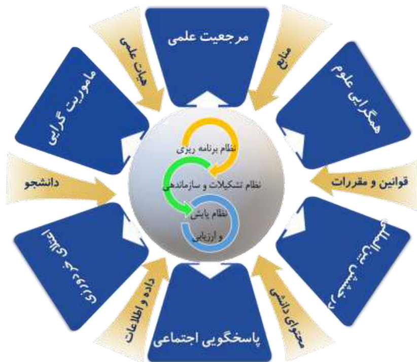
شکل ۴. خروجیهای موردانتظار الگو و ارتباطات درون سیستمی با اجزای دیگر