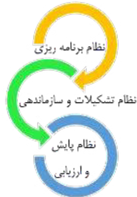
شکل ۲. نظامهای کلان سه گانه الگو و تعاملات آنها