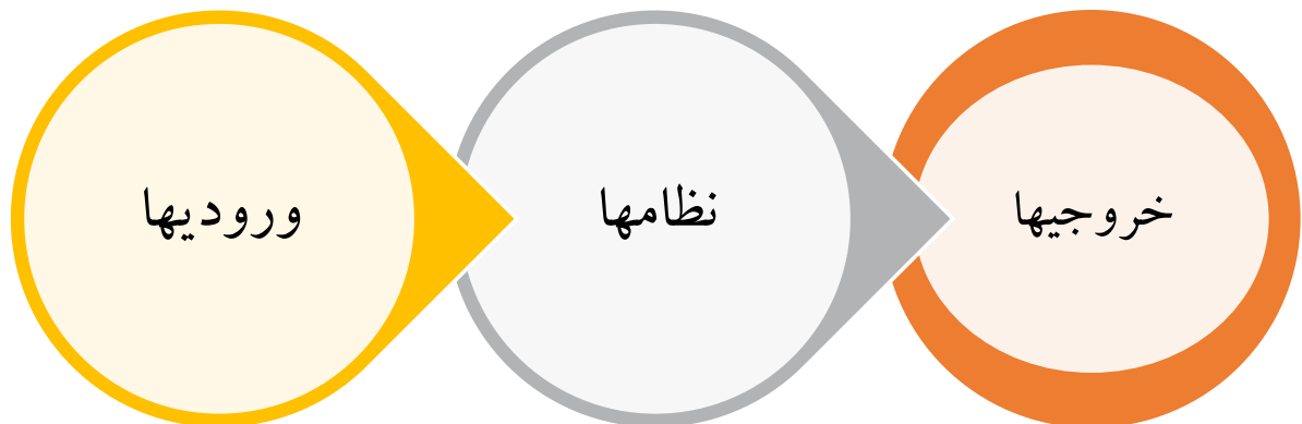
شکل ۱. مدل مفهومی الگوی شش وجهی تعالی دانشگاه بر پایه ساز و کار سیستمی

سیاستگذاری، اجرا و ارزیابی از جمله ارکان مهمی است که لازم است در فرایند سیاستگذاری مورد ملاحظه قرار گیرد و توجه به تمامی این ارکان در سطوح مختلف نظام های سیاستگذاری ضروری می باشد (۵). همچنین چنانچه به دانشگاه به عنوان یک جزء از سیستم آموزش عالی نگریسته شود، بدون شک ضروری است تا ورودی ها و خروجی های این سیستم در هریک از ارکان سیاستگذاری مدنظر قرار گیرد. بر این اساس