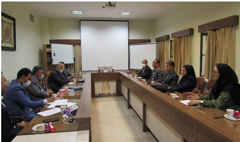
جلسه با کارشناسان دفتر معاونت اجتماعی استانداری در سالن کنفرانس پژوهشکده آینده پژوهی

جلسه‌ای با کارشناسان دفتر معاونت اجتماعی استانداری برای تعریف فعالیت‌های مشترک برگزار شد. در این جلسه مقرر گردید، به زودی سامانه اندیشکده حوزه اجتماعی استانداری در پژوهشکده ارائه شود و پژوهشگران شاغل در پژوهشکده بازخورد علمی خود را اعلام نمایند. همچنین مقرر شد مهارت‌های لازم برای برخی مشاغل کلیدی در قالب سامانه کوله پشتی از طرف پژوهشکده ارائه شود و در این خصوص جلسات کارشناسی در اسرع وقت برگزار شود.