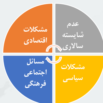
عوامل دافعه کشورهای مهاجر فرست

دانشگاه‌ها و صنعت منجر به ایجاد فرصت‌های شغلی و پرورش نوآوری می‌شود و می‌تواند استعدادها را در کشور جذب و حفظ کند.